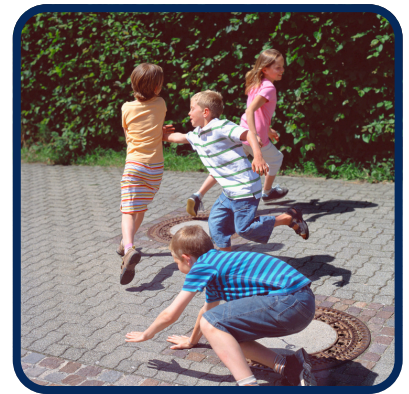
Ce jeu ressemble à 1-2-3 soleil